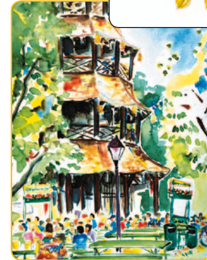
Konzept und Koordination: HoSeCo Sales & Marketing Services (Deutschland) Ltd. - Titelbild: »Chinesischer Turm« by Kristen Fillkrog

...und der Tag wird gut ...and you'll have a great day